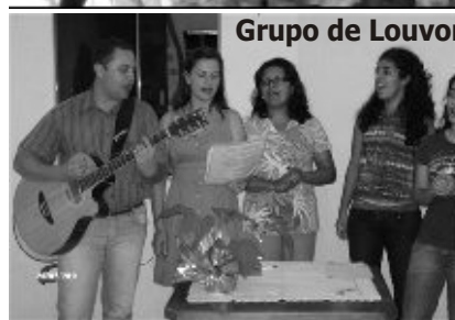
Grupo de Louvor