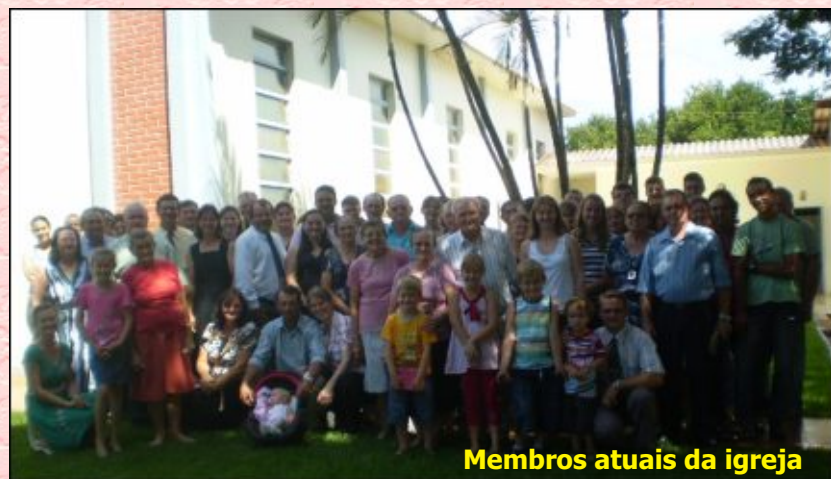
Membros atuais da igreja