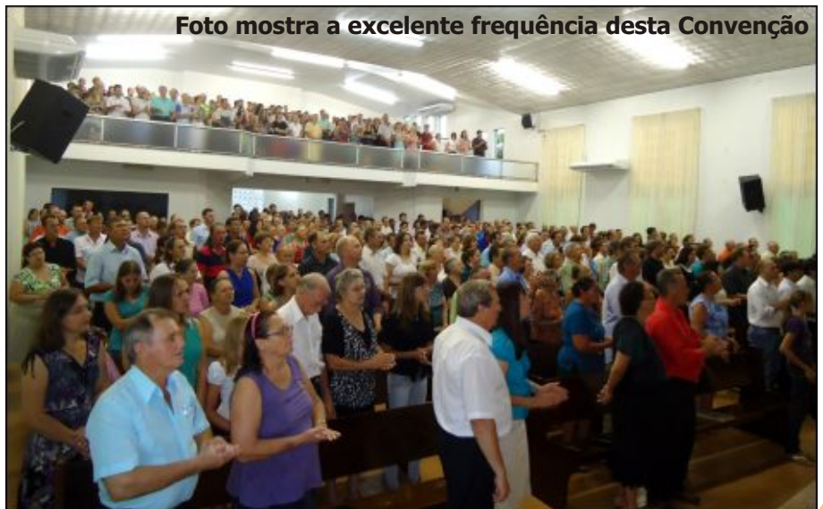
Foto mostra a excelente frequência desta Convenção